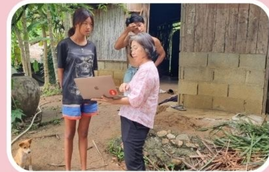
3. ปัญหาคุณแม่วัยใส 1 คน