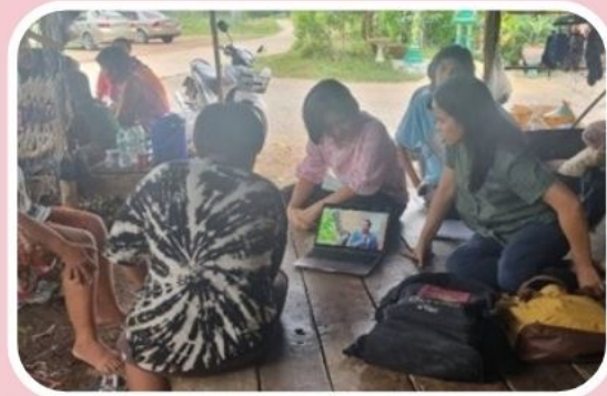
5. ติดเกม 3 คน