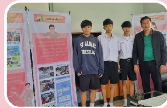
6. ปัญหาด้านความประพฤติ / การปรับตัว 10 คน