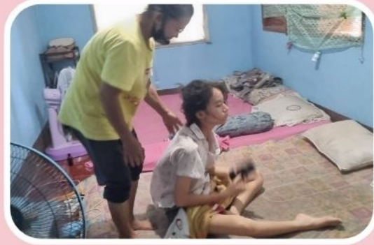
2. ปัญหาด้านครอบครัว (ยากจน , พ่อแม่แยกทาง) 7 คน