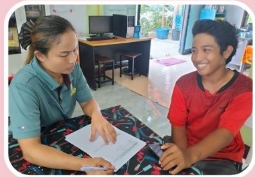
4. ปัญหาบทกพร่องทางการเรียนรู้ 2 คน