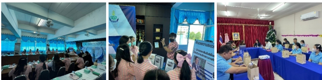
ผู้บริหาร ครู ตัวแทนคณะกรรมการสถานศึกษาศึกษาดูงานโรงเรียน และศูนย์การเรียนรู้ดอนบอสโก