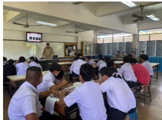
ผู้บริหาร ครูร่วมนิเทศ สังเกตชั้นเรียนนำผลการสังเกต ร่วม PLC นำผลปรับปรุงพัฒนาการจัดการเรียนรู้