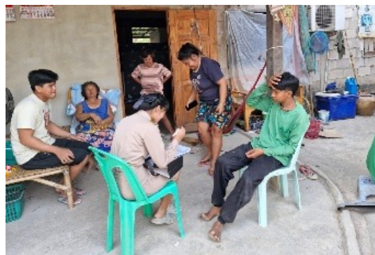
สำรวจค้นหานักเรียนหลุดออกจากระบบการศึกษา จัดทำเป็นฐานข้อมูลและเชื่อมฐานข้อมูลกับโรงพยาบาลส่งเสริมสุขภาพตำบลแพงพวย โรงพยาบาลส่งเสริมสุขภาพตำบล สีหมีน อบต.แพงพวย และอบต.สีหมีน