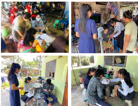
นักเรียนห้องเรียน บวร สร้างโอกาส เรียนรู้แบบครูเดินสอน