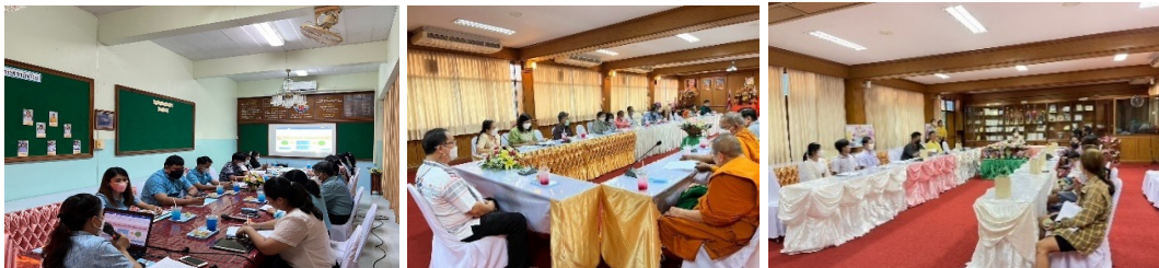
ประชุมครู คณะกรรมการสถานศึกษาและผู้ปกครองสื่อสารและสร้างความรู้ความเข้าใจเกี่ยวกับนวัตกรรม