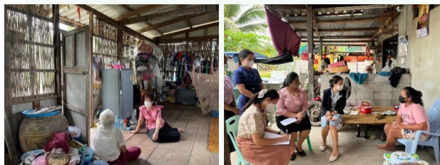
ผู้บริหาร ครู และเครือข่ายบวร ร่วมลงพื้นที่เยี่ยมบ้านนักเรียนกลุ่มปกติและกลุ่มเสี่ยงออกกลางคัน