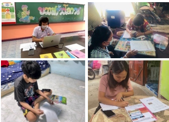
นักเรียนห้องเรียน บวร สร้างโอกาส เรียนรู้ด้วยตนเอง