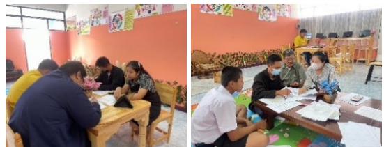
นักเรียนห้องเรียน บวร สร้างโอกาส เรียนรู้แบบพบกลุ่ม