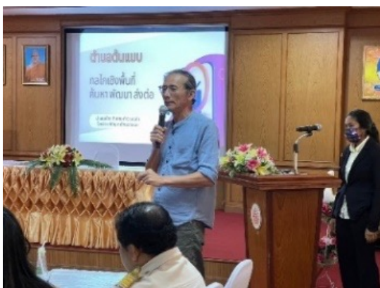
เสวนาการพัฒนาภาคเอกชนพื้นที่และร่วมวางแผนร่วมกัน ติดตามนักเรียนที่หลุดออกจากระบบการศึกษาให้กลับเข้าสู่ระบบร่วมกับเครือข่ายที่ MOU ผู้แทนกสศ. ผู้แทนสพฐ. ศูนย์การเรียนรู้ CYF และเครือข่าย บวร