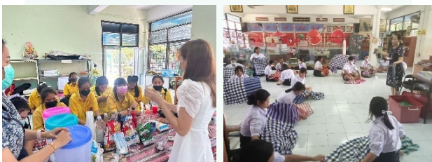
นักเรียนฝึกทักษะอาชีพร่วมกับวิทยาลัยสารพัดช่างราชบุรี และพัฒนาสังคมและความมั่นคงของมนุษย์จังหวัด