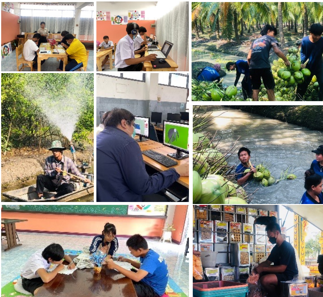
นักเรียนมีทักษะและสมรรถนะที่เกิดจากการเรียนและนำไปประยุกต์ใช้ได้ในชีวิตจริง

ทักษะชีวิตนักเรียนเป็นสมาชิกที่ดีของครอบครัวทำงานแบ่งเบาภาระของครอบครัวและสามารถอยู่ร่วมกันผู้อื่นบนความแตกต่างและหลากหลาย