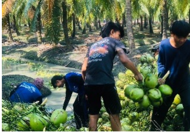
การวัดและประเมินผลจากสภาพจริงและเป็นองค์รวมโดยคำนึงถึงความแตกต่างระหว่างบุคคลและการพัฒนาการของนักเรียน สังเกตพฤติกรรมการทำงานและการเรียนรู้ ผลงาน/ชิ้นงาน

กลุ่มที่ 1 สำหรับนักเรียนที่เรียนในห้องเรียนปกติ วัดและประเมินผลตามระเบียบวัดและประเมินผลของโรงเรียนให้สอดคล้องกับหลักการการวัดและประเมินผลจากสภาพจริง บูรณาการผลงาน ชิ้นงานทั้ง 8 กลุ่มสาระการเรียนรู้โดยคำนึงถึงความแตกต่างระหว่างบุคคลและตามหลักการแนวคิดของการจัดการศึกษาตามรูปแบบในระบบและมีการเทียบโอนความรู้และประสบการณ์จาก ชิ้นงาน/ผลงาน ฯลฯ ที่เกิดขึ้นจากการเรียนรู้ด้วยตนเองด้วยรูปแบบนอกระบบและตาม อรรถยาศัยเน้นการมีส่วนร่วมของนักเรียน ผู้ปกครองและชุมชนในการวัดและประเมินผล